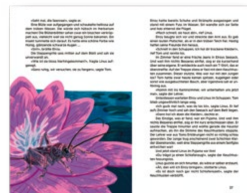
Club der Doofen 3 – Die Geisterfalle SJW Nr. 2646 CHF 7.- pro Heft