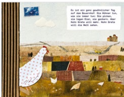
Huhn Grete will die Welt sehen SJW Nr. 2670 CHF 7.- pro Heft