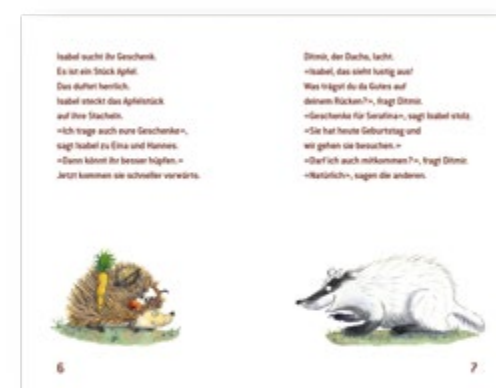
Serafinas Geburtstag SJW Nr. 2648 CHF 7.- pro Heft