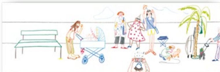
Via Mare SJW Nr. 2674 CHF 7.- pro Heft