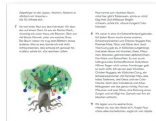
Das Dach SJW Nr. 2626 CHF 7.- pro Heft